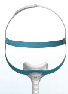
Máscara Nasal Evora