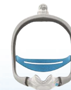
Máscara Nasal Air Touch N30i