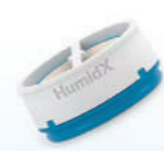
Filtro para Airmini HumiDX