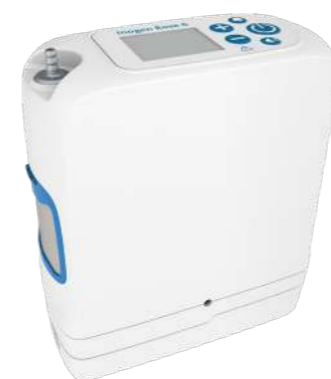
Concentrador de Oxigênio Portátil ROVE 6