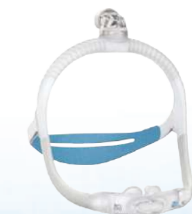
Máscara Pillow Airfit P30i