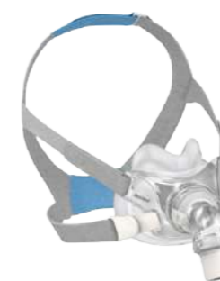
Máscara Facial Airfit F30