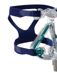
Máscara Facial Mirage Quattro c/entrada p/O2