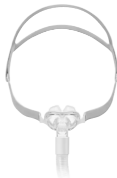
Máscara Pillow YP01