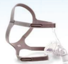
Máscara Nasal Pico