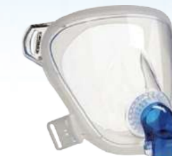
Máscara Full Face Fitlife