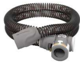
Traqueia Aquecida Resmed