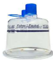
Jarra Umidificação Descartável