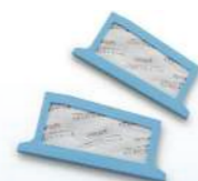
Filtro Ultrafino DreamStation