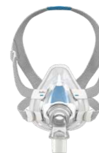
Máscara Facial Airfit F20