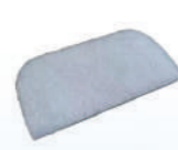
Filtro para Sleepive