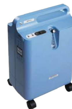
Concentrador de Oxigênio EverFlo 5 LPM