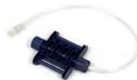
Sensor de esforço respiratório