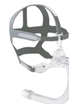
Máscara Wisp Youth Juvenil