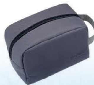
Bolsa de transporte