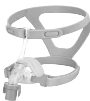
Máscara Nasal YN02