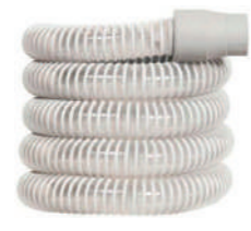
Traqueia Branca Premium PHILIPS