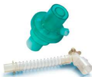
Filtro HME Pediátrico