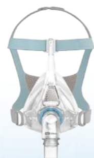
Máscara Facial Vitera