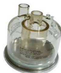
Jarra Umidificação Reutilizável