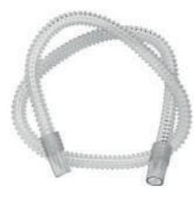
Traqueia 1,8m ventcare