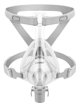
Máscara Facial YF01