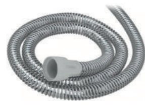
Traqueia Slimlime Resmed