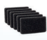
Filtro para CPAP Yuwell