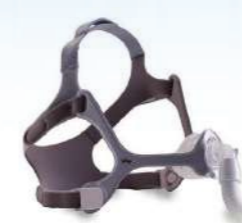
Máscara Nasal Wisp