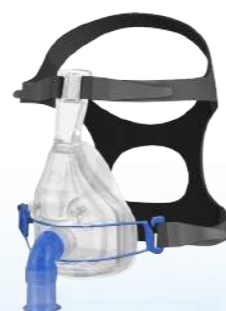
Máscaras Facial Freemotion