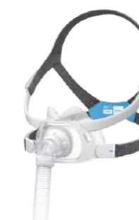
Máscara Facial Airfit F40