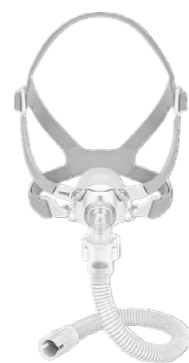
Máscara Nasal YN03