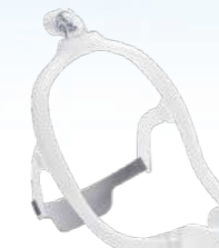
Máscara Nasal DreamWear