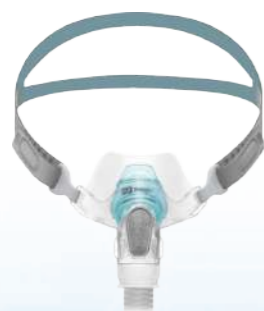
Máscara Pillow Brevida