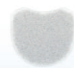
Filtro para Armini