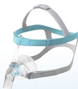
Máscara Nasal Eson 2