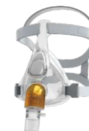
Máscara Facial Nivairo c/ entrada p/ O2