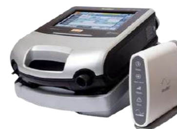
Astral 100 e 150