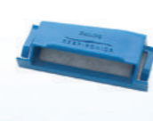
Filtro Polen DreamStation