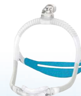
Máscara Nasal Airfit N30i