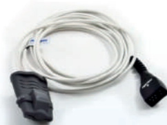
Sensor SP02 reutilizável