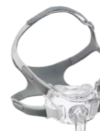
Máscara Facial Amara View