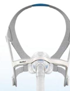
Máscara Nasal Airfit N20