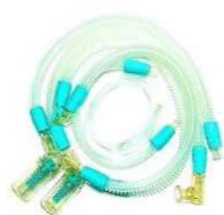
Circuito Reutilizável Adulto e Pediátrico