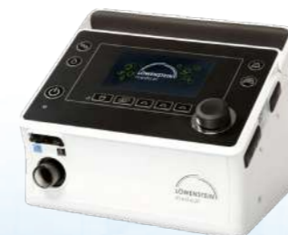
Prisma 50 Vent LÖWENSTEIN

Possui 5 configurações de resistência (para se ajustar à capacidade expiratória de cada paciente). É fácil de usar, limpar e desinfetar, além de ser compatível com a terapia de nebulização.