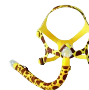
Máscara Wisp Pediátrica