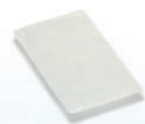
Filtro ultrafino para CPAP Airsense 10