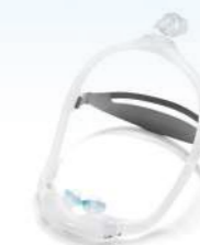
Máscara Pillow DreamWear