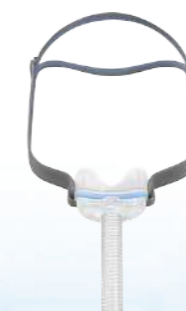
Máscara Nasal Airfit N30