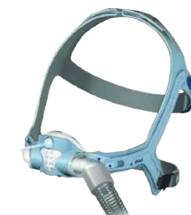
Máscara Pixi 5i